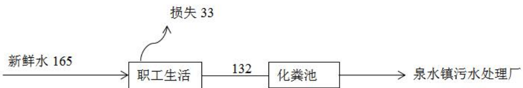
图 1-1 水平衡图 单位：t/a